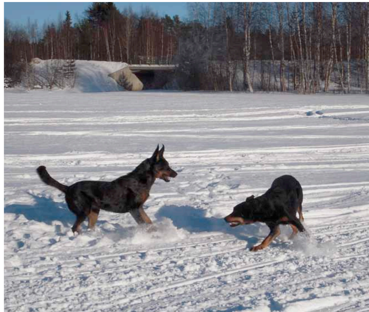
Taggen och Grim leker.