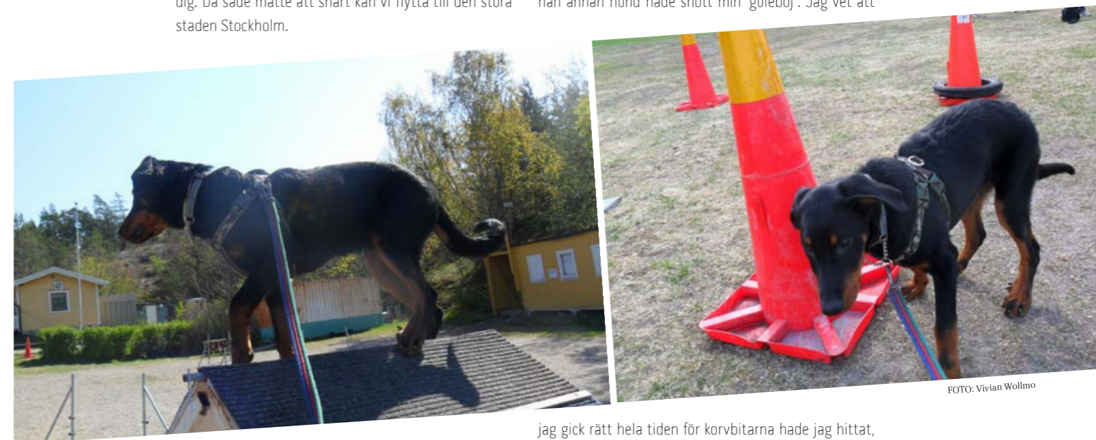
Frasse provar utrustningen på Nacka BK.

Vi spårade igår, men hade inte märkt upp spåret, så nån annan hund hade snott min "guleböj". Jag vet att