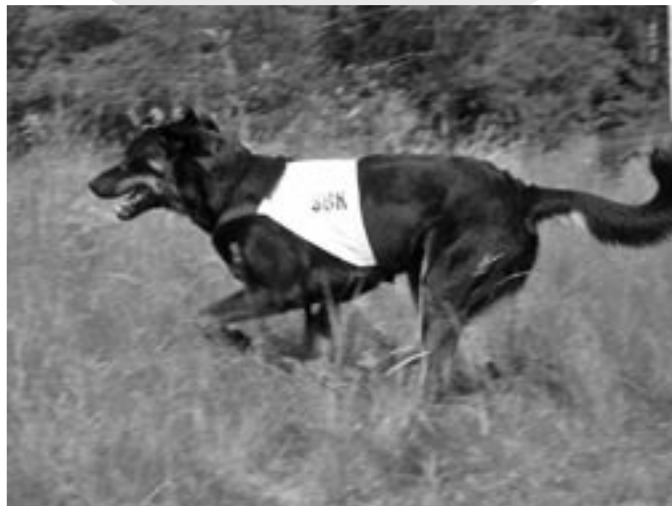
Pike i full färd mot championatet!

Skickar ett kort på vår Saphir som är taget under en busstur. Hon håller koll på vad medpassagerarna sysslar med...kanske kan det vankas en godbit!