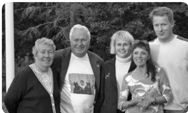
Foto och resultat har skickats in av Erja Pitkänen, sekreterare i Finska Beauceronklubben