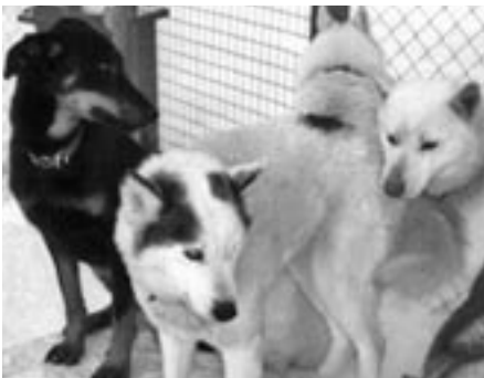
Zorba gick på fårvallningskurs men vallar nötkreatur på hobbynivå. Hennes helbror Rö-holmen's Achzeho var också på gården ett tag men gick inte överens med vare sig katten eller de övriga djuren. Zorba hänger gärna med sina kennelkompisar när de sticker ut på tur.