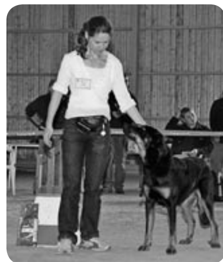
Onks Toi Uniikki