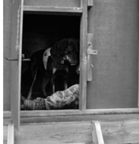
Streif fick sadla om till skallmarkering.. Det byggde på hans glädje enormt i sökandet.