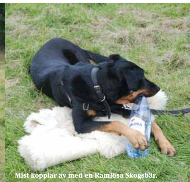
Mist kopplar av med en Ramlösa Skogsbär.