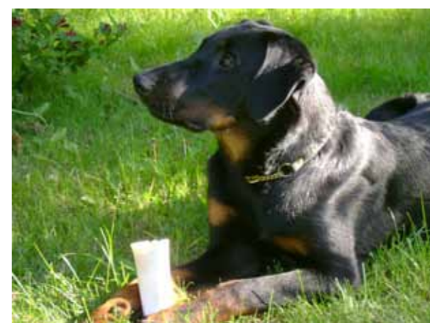
Jätterädd liten vovve ...

Den "lille vovven" tar då i samma ögonblick ett rejält skutt fram mot mannen samtidigt som han ger till ett mörkt, starkt, och kraftigt rytande. Alla tre männen hoppar högt upp i luften och tappar alla sina spadar tillsammans med alla sina intryck som kraftfulla män. I nästa sekund lägger sig hunden på marken och skäller dovt och vaktande. Männen rör inte en